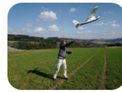
MAVinci Intel Sirius Pro (+ Fuji X-M1)

Effektive Feuerwehreinsätze hängen davon ab, wie schnell und umfassend die Einsatzleitung die Gefahrensituation einschätzen kann. Aktuelle Lagedaten, die aus der Luft gewonnen werden, können dabei erheblich zur verbesserten Beurteilung der Gefahrenlage beitragen. Für die Gewinnung dieser Daten sind Drohnen geeignet, die eine umfassend automatisierte Datenerfassung und -verarbeitung leisten können. Das Projekt VISION (Vernetzte integrierte UAS-gestützte Datenerfassung und -aufbereitung für die Unterstützung von Behörden und Organisationen mit Sicherheitsaufgaben im Bevölkerungsschutz) realisiert ein solches System für Rettungskräfte unter Nutzung eines hochleistungsfähigen Kippflügel-Flugzeugs, das auf einem vollautomatischen Flugführungssystem basiert. Die im Projekt entwickelte Lösung ist dabei voll integriert in den gemeinsam mit