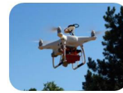
DJI Phantom 4 Pro